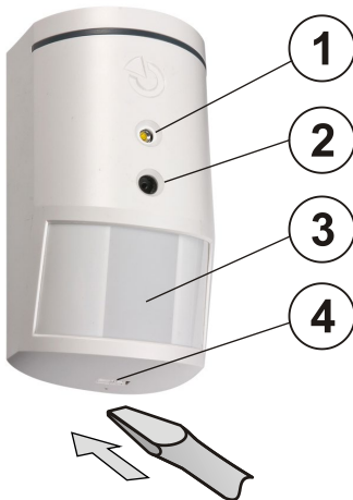
Figure : 1 – flash pour illumination ; 2 – objectif de l'appareil photo ; 3 – lentille de détecteur PIR ; 4 – couvercle de patte